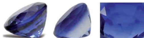
2. ábra: diffúzióval kezelt szintetikus zafír levegőben (balról) és immerziós folyadékban (középen). A jobboldali képen hajlott növekedési vonalak árulják el a szintetikus származást. Ki gondolt volna, hogy nem csak természetes leukozafirokat kezelik!

találkozunk nem beszélve a gyenge kivitelű, gépi csiszolású szintetikus kövekről. Ahhoz, hogy végére járjak a kérdésnek elvégezhetem volna további, meglehetősen drága és időigényes nagyműszeres vizsgálatokat, de a megrendelőmnek vidékre ment a busza és nagyon sietett. Abban maradtunk, hogy pár hét múlva újra eljön és elhozza a többi követ, bár azok már a foglalónál vannak.