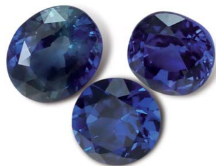
1. ábra: három kékség. Balról természetes, kezeletlen zafír. Jobbról diffúzióval kezelt szintetikus zafír. Középen szintetikus spinell.

Azért is nagyon örültem, hogy a laborba az első munkanapon éppen három kékséget hoztak vizsgálatra. Kettőről gyorsan kiderült, hogy szintetikus spinellek. A harmadik kövel pedig igen meg kellett dolgoznom: minden műszeresen mért jellemzője, az anizotrop viselkedése és a jellegzetes pleokrozizmus korundra utaltak. A kő azonban zárványmentes volt. Sem a természetes származására, sem szintetikus mivoltára utaló jellegzetes belső ismérveket nem találtam benne, a besorolási különbség pedig több százezer forintban mérhető.